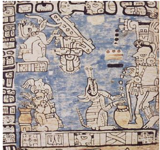
Perro en escena ritual. En el mundo náhuatl el perro fue el dios Xólotl y representa la oscuridad, inframundo y muerte. Códice Madrid.

En las culturas prehispánicas, el animal ha constituido una fuente inagotable de simbolismo y respeto. La serpiente, el águila, el conejo, el jaguar, el gato o el mono son sólo algunas especies que han sido veneradas por diferentes culturas, desde la egipcia hasta la china, árabe o americana.