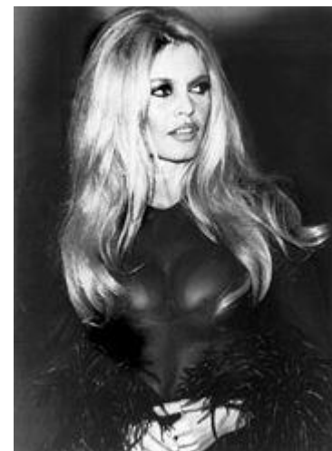
En 1976 creó la Fundación Brigitte Bardot para la protección de animales en peligro.