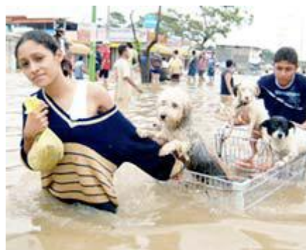
En el 2007 las inundaciones de Tabasco cubrieron el 80% del estado. Miembros de APASDEM mandaron brigadas de rescate.

Por ello Socorro Animal decidió no pedir donativos y solventar los gastos con recursos propios que incluyen gastos de alimentación, vacunas, veterinario, utensilios y productos de higiene, transporte para visitas médicas y limpieza de instalaciones. Una labor completamente altruista a favor de los animales.