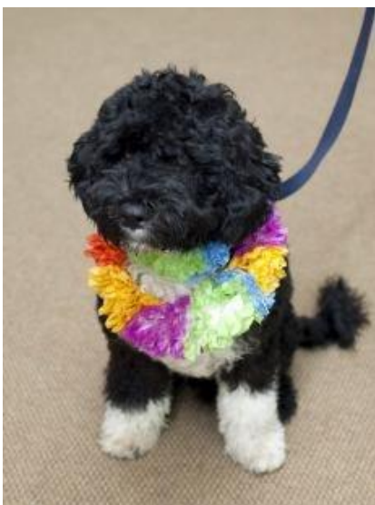
Bo, el perro más famoso del año. Regalo del senador Edward Kennedy a la familia Obama.

David, un familiar suyo y su amigo coincidieron en su interés por los animales y decidieron constituir Socorro Animal A.C. en el año de 1992, al principio las actividades de protección y rescate de perros y gatos callejeros la realizaban de acuerdo a sus posibilidades económicas y de tiempo, “comenzamos de cero, empezamos a involucrarnos en el mundo de la protección animal y a conocer veterinarios”, comentó David para ecosmedia.