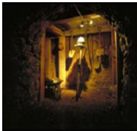
Aganguero se ubica a 33 K de Zitácuaro y en purépecha significa "Dentro del Bosque" o "Entrada a la cueva".

Pero el descubrimiento de la mariposa monarca en los bosques de la región, dio a Aganguero un segundo respiro. Se empezaron a formar cooperativas de servicios, rutas turísticas y actividades recreativas con el fin de atraer visitantes y reactivar la economía local. A la fecha el pintoresco pueblo vive, entre otras actividades, del turismo que llega a visitar a las mariposas.